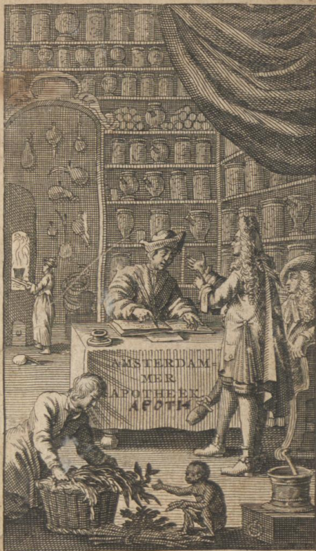
† AMSTERDAM by NICOLAS ten HOORN.